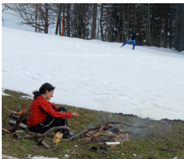
hiver 06/07