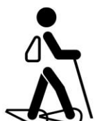
Marcheur avec raquettes