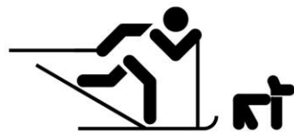
Skieur avec chien