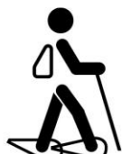
Marcheur avec raquettes